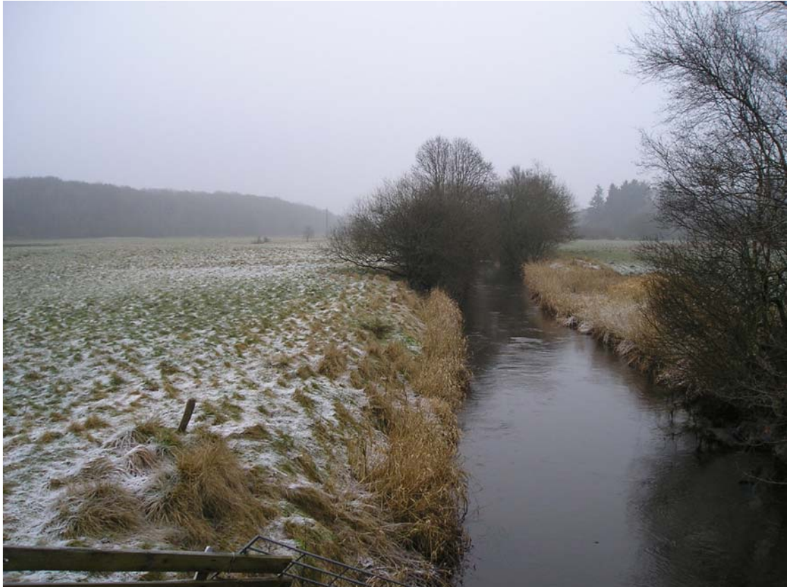
Figur 1.1.2: Varde Å ved Hessel Bro, set mod øst.

Som følge af vandtabet er Varde Å's bundbredde reduceret fra oprindeligt 10 - 15 m til nu kun 4 - 7 m samtidig med, at bunden er hævet betydeligt. Endvidere er strækningen mellem Hessel og Nørholm blev uddybet og rettet ud i 1950'erne. Strækningen, der oprindeligt var 10 km lang og havde 35 åslynger, blev reduceret til 5 - 6 km åløb med kanalagtigt forløb (figur 1.1.2).